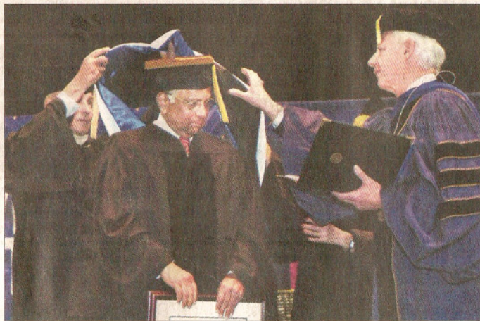
TOP HONOURS: Union agriculture minister Sharad Pawar receives doctorate from top brass of Lawrence Tech University

The 4,500-student university also offers programmes with partner universities in Canada,