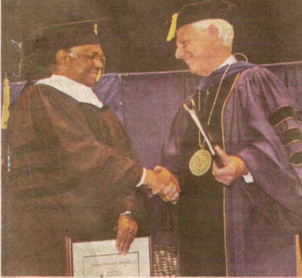
डेटाईट : अमेरिकेतील 'लॉरेन्स टेक्निकल युनिव्हर्सिटी'ने केंद्रीय कृषिमंत्री शरद पवार यांना 'डॉक्टर ऑफ ह्युमॅनिटीज' पदवी प्रदान करून गौरविले.

अमेरिकेत सन्मान : 'लॉरेन्स टेक' विद्यापीठाकडून 'डॉक्टर ऑफ ह्युमॅनिटीज' पदवी